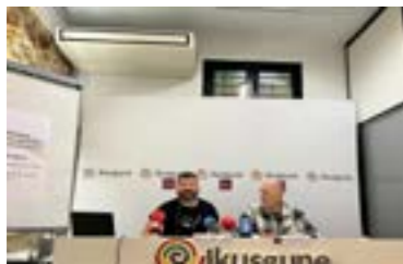
Rueda de prensa 18/04/2023 Vitoria-Gasteiz

Las personas LGTBI+ tienen problemas para que sus realidades sean reconocidas en los juzgados. Como hemos dicho en diferentes ocasiones, no basta hacer leyes para que los derechos sean reconocidos y los daños reparados. Es fundamental que se puedan acceder a los recursos judiciales y disponer de personal capacitado y sensible. Existen numerosos ejemplos para afirmar que la judicatura, en muchas ocasiones, está formada por personas profundamente machistas y LGTBI+fóbicas y que la perspectiva feminista e interseccional ni está ni se la espera. En este contexto, el respaldo que ofrecemos desde los colectivos, movimientos e instituciones es de gran ayuda para las personas que sufren violencias machistas.