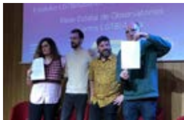
Rueda de prensa 20/11/2023 Barcelona